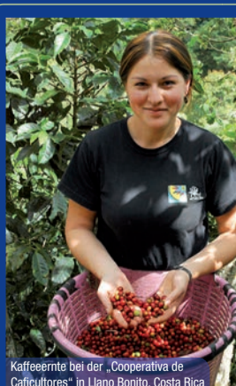
Kaffeeernte bei der „Cooperativa de Caficultores“ in Llano Bonito, Costa Rica